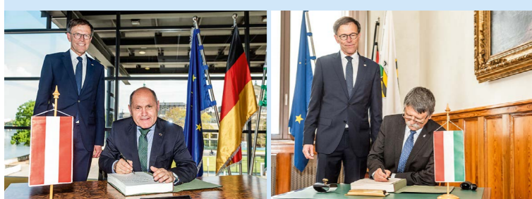
Anlässlich der Konferenz »Quo vadis, Mitteleuropa?« des Forums Mitteleuropa besuchten Wolfgang Sobotka, Präsident des Nationalrats der Republik Österreich, sowie Dr. László Kövér, Präsident der Ungarischen Nationalversammlung, den Sächsischen Landtag. Beide trugen sich in das Gästebuch des Parlaments ein.