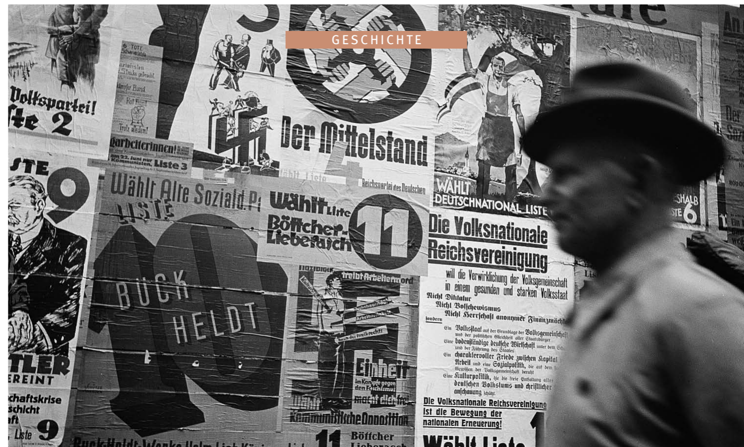
// Mann vor einer Hauswand mit Wahlplakaten verschiedener Parteien anlässlich der Landtagswahl am 12. Mai 1929.

Diese Konstellation hielt nicht lange. Die Zustimmung Sachsens zum umstrittenen Young-Plan (Neuregelung der Kriegsreparationen) war nur der Vorwand am 18. Februar 1930 das Kabinett Bünger zu stürzen. Der entscheidende Auflösungsantrag kam von der NSDAP.