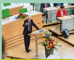
Seite 15: Feierstunde zu 70 Jahre Grundgesetz