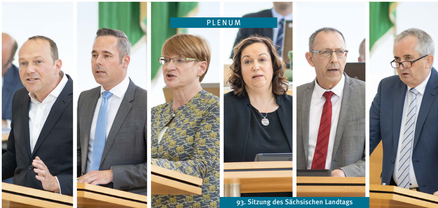
93. Sitzung des Sächsischen Landtags