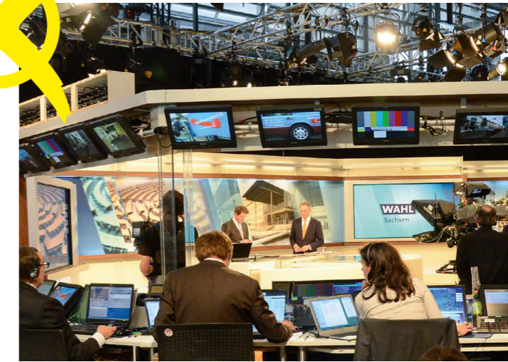
// Wahlabend 2014 im Sächsischen Landtag //

den Landtag entsenden, wie Mandate auf sie entfallen sind.