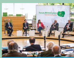
Seite 11: Konferenz des Forums Mitteleuropa 2019