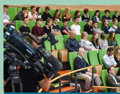
Seite 3: Debatten zu Tourismus und Artenschutz