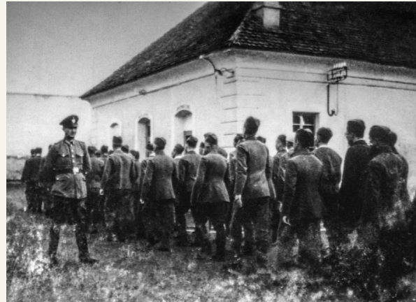
Häftlinge des Polizeigefängnisses der Gestapo in der Kleinen Festung Theresienstadt

Die Kleine Festung diente den Nationalsozialisten seit Juni 1940 als Außenstelle des Prager Gestapo-Gefängnisses Pankrác. Insgesamt 27 000 Männer und 5 000 Frauen, vornehmlich Tschechen, durchliefen das Gefängnis. Viele von ihnen waren politische Häftlinge, tschechische Patrioten und Widerstandskämpfer. Aber es gab auch inhaftierte Juden und Kriegsgefangene aus verschiedenen Ländern. Neben zahlreichen, der Gewalt und den widrigen Bedingungen geschuldeten Opfern war die Kleine Festung Hinrichtungsort für 300 Menschen.